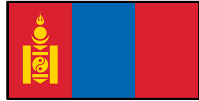
Soiombo , Zanabazar 1686

Sukhbaatar, Dornod, Khentii: Densità di popolazione 0,7 per km 2 .